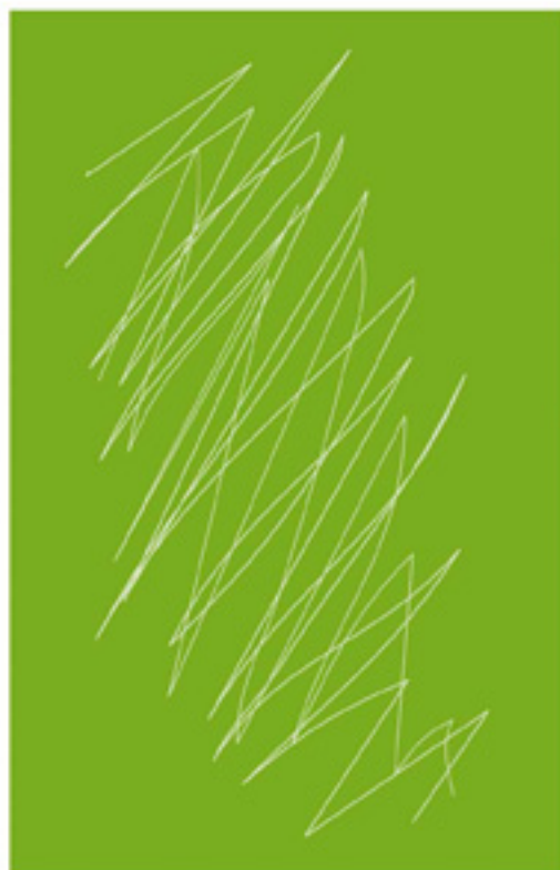
Finitura brillante tradizionale