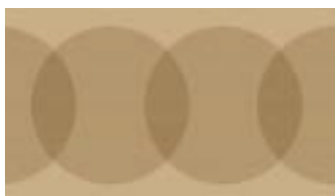
Formica Impress -välitilalaminaatti.

– Pinc House Delight 66:n materiaalit ovat hyvin help-pohitoisia, Johan jatkaa. Koko julkisivu on ver-hottu Formica Exteriorilla, jota ei tarvitse koskaan raaputtaa puhtaaksi ja maalata uudelleen. Pelkkä pesu riittää. Säänkestävä UV-testattu materiaali kestää hyvin naarmuuntumista ja pysyy siten kauniina vuodesta toiseen. Pinc House Delight 66 on tarkoitettu ihmisille, jotka eivät halua käyttää lomaansa kesämökin remon-toimiseen. Se on vapaa-ajanasunto ihmisille, jotka haluavat... vapaa-aikaa.